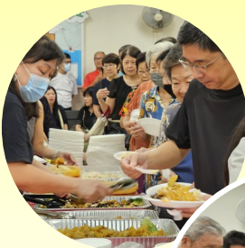
弟兄姐妹享用丰盛的晚餐