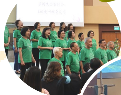
从“年幼到年长、华语及厦语崇拜”的弟兄姐妹带领敬拜、读经及献诗，体现了“多元、多代崇拜”的合一景象